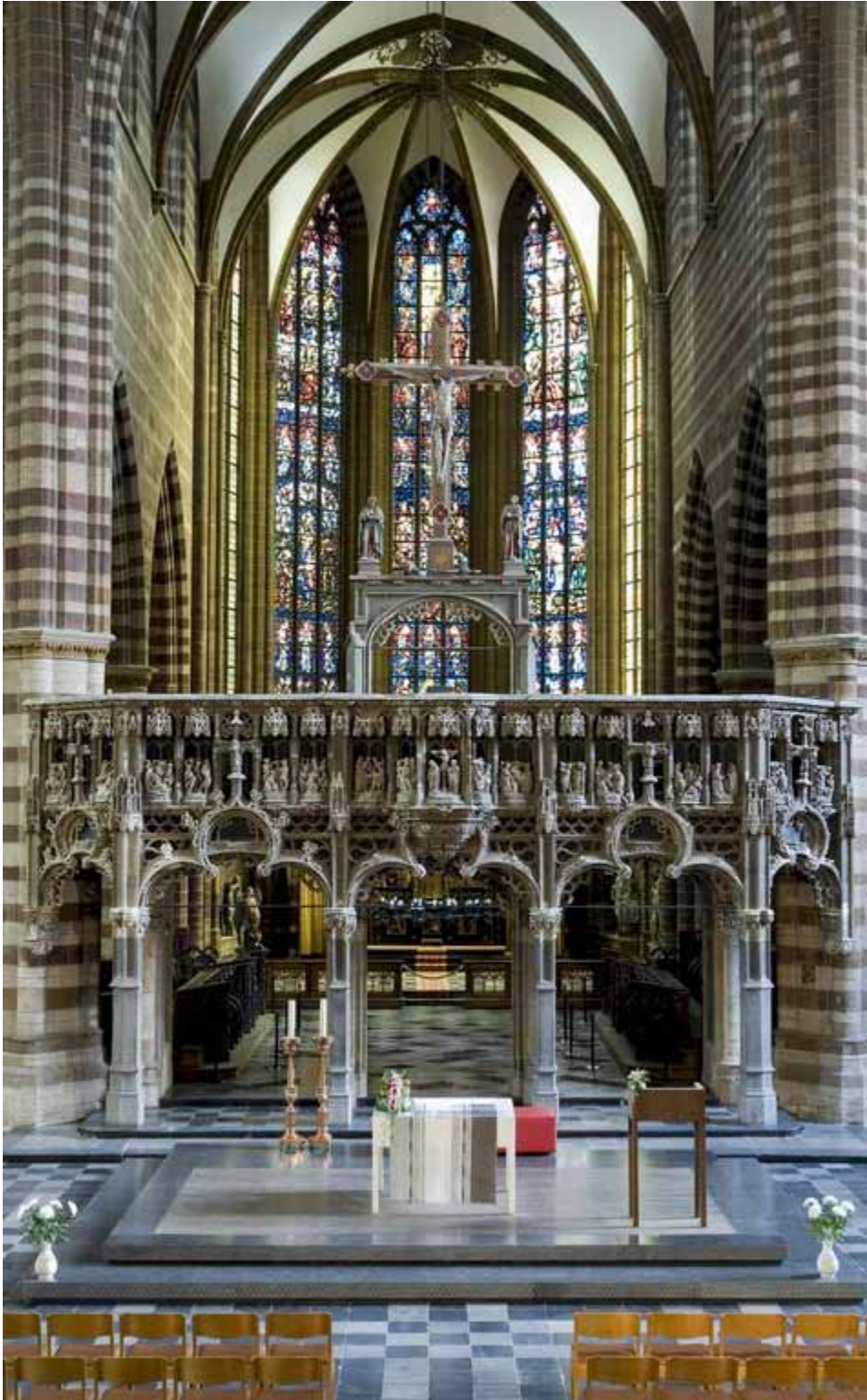
Figuur 7-22-1 Het oksaal in de kerk O.L. Vrouw in Aarschot.